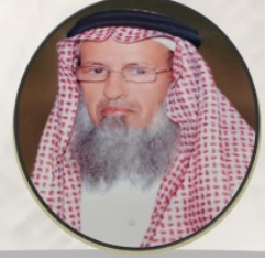
الشيخ: سعد سعيد آل سالم (الرئيس)