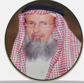
الشيخ: سعد سعيد آل سالم (الرئيس)